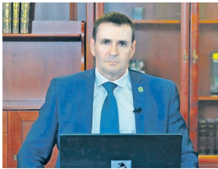
Ещё до старта трансляции глава региона получил более 3 тысяч вопросов, а порядка 3,5 тыс. поступило во время эфира

Вопрос, который затрагивает интересы многих жителей края, – благоустройство дворов. Врио губернатора напомнил, что за этот год на программу ремонта дворовых территорий дополнительно привлечено 677 млн. рублей, что позволит привести в порядок около