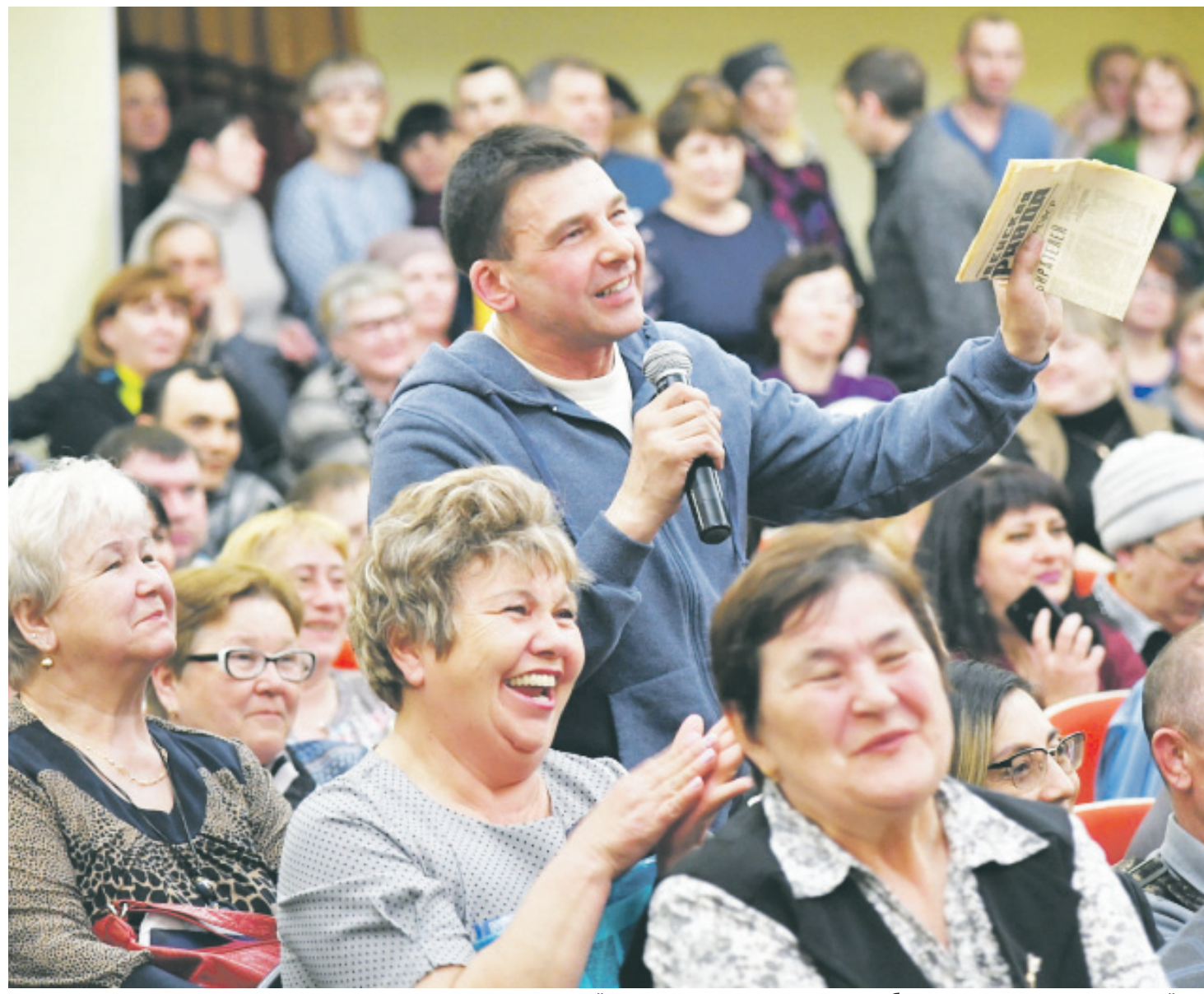
Идею строительства в Охотском районе нового энергопроизводства губернатору подсказали жители района

Губернатор Хабаровского края категорически не поддерживает инициативу депутатов региональной Законодательной думы по снижению транспортного налога. «В том виде, в котором депутаты краевой думы предлагают снизить транспортный налог, делать это недопустимо», заявил Сергей Фургал. – Потому что в результате снижение будет производиться для дорогих богатых иномарок. Я тоже считаю, что транспортный налог в крае нужно снижать, но таким образом, чтобы наибольшую выгоду от этого получили наименее обеспеченные слои населения».